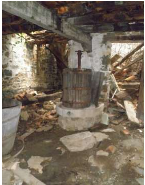
Slika 9: Stara klet