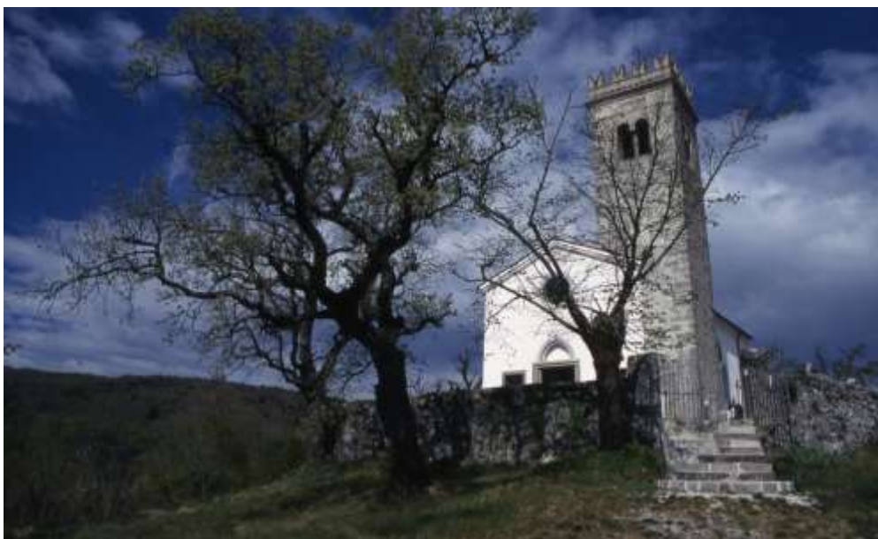
Slika 13: Cerkev Marije Device na Jezeru

( http://www.brda.si/mma/Cerkev%20SV.%20Marije%20na%20jezeru%20Golo%20Brdo/2012012911135191/mid/ )