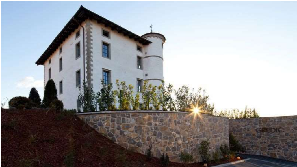
Slika 7: Gredič

Grad Gredič je bil zgrajen leta 1774 na manjši vzpetini. Prikazuje vse značilnosti okolja, v katerem je nastal. Navdušuje z eleganco in bogato notranjo opremo, preseneti pa s spektakularnostjo vinske kleti.