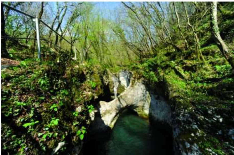
Slika 12: Krčnik

( http://www.slovenia.info/pictures%5Ctown%5C1%5C2010%5C%C4%B9%CB%87martno_288025.jpg )