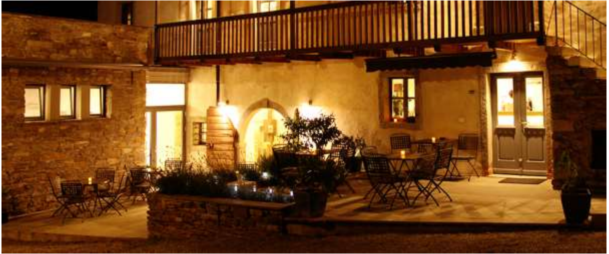
Slika 6: Hotel Dvor

( http://www.dvor.si/_cache/rsklan/tiger-BC-2A/thumb/980x410/upload_IMG_8615_980.jpg )