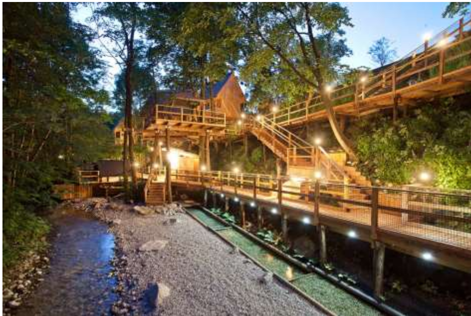
Slika 5: Hiška na drevesu

Garden Village je popolnoma ekološki in inovativno zasnovan projekt. Zgrajen je na opuščeni vrtarji, ozaveščenim gostom pa omogoča samozadostno bivanje. Ima lastno vodno vrtino z neoporečno pitno vodo, rastlinjak, in polnilne postaje za električna vozila. Pri izgradnji so bili uporabljeni naravi prijazni materiali. Kompleks sestavlja 6 hišk v drevesnih krošnjah, 9 avanturističnih šotorov ob potoku, 6 glamuroznih šotorov in 2 luksuzna apartmaja z jacuzzijem.