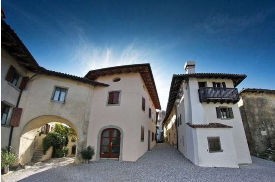
Slika 11: Šmartno

( http://www.slovenia.info/pictures%5Ctown%5C1%5C2010%5C%C4%B9%CB%87martno_288025.jpg )