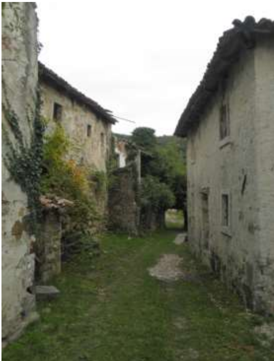
Slika 8: Slapnik

Slapnik je manjša gručasta vas, ki leži v zgornjem delu Goriških Brd. Ima značilno briško arhitekturo in je poln prelepih kamnoseških detajlov. Naselje so ljudje začeli zapuščati po drugi svetovni vojni in je danes popolnoma brez prebivalcev. Kljub temu, da je naselje razglašeno za kulturni spomenik, zaradi opuščenosti in nevzdrževanja objektov propada.