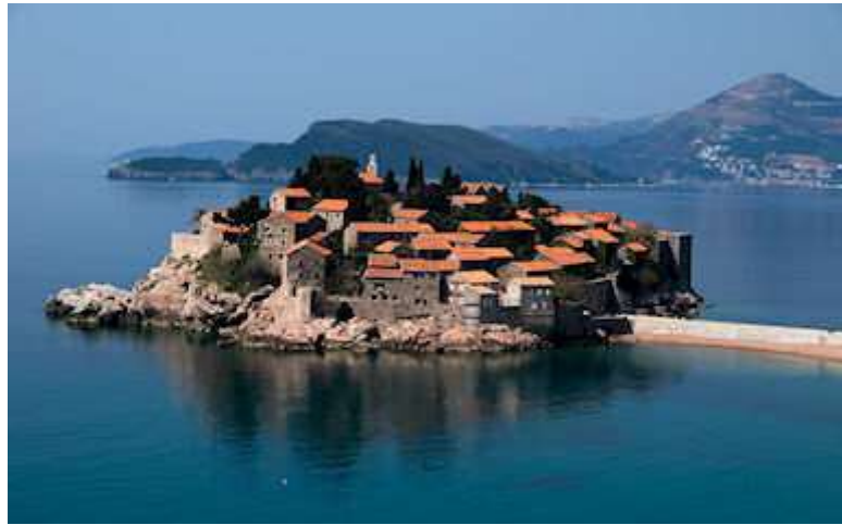
Slika 3: Sveti Štefan

prenova je bila zasnovana na način, da obiskovalcem omogoča začutiti zgodovinsko umetnost kraja ( http://www.amanresorts.com/amansvetistefan/resort.aspx ).