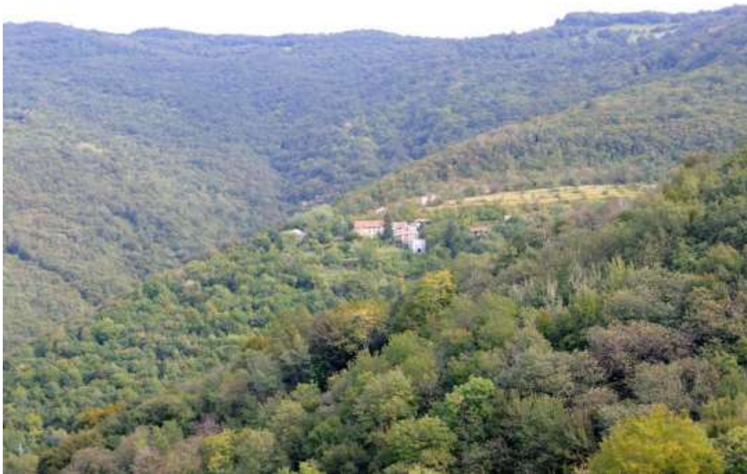
Slika 10: Lega Slapnika

Vas Slapnik leži na nadmorski višini 360 m na zahodnem pobočju hriba Korade. Že ob prvem pogledu na okolje je opaziti, da je bila vas zgrajena zelo premišljeno, saj je postavljena na sončno pobočje hriba, tako da lahko izkorišča vse dobre lastnosti sončnega sevanja. Vas se podreja okolju in je dobro zavarovana pred vremenskimi vplivi. Gre za klasičen primer gradnje, ki izraža sožitje človeka z naravo.