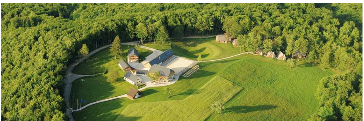
Slika 4: Posestvo Pule

Posestvo Pule je elitno podeželsko naselje v luksuzni kategoriji. Prenova domačije zgrajene v 17.stoletju je potekala v skladu z ohranjenimi arhivskimi, fotografskimi in ustnimi viri ter po vzorih okoliške stavbne dediščine. Posestvo sestavljajo kmečke hiše, čebeljnjak, kozolec in pet gospodarskih poslopij.