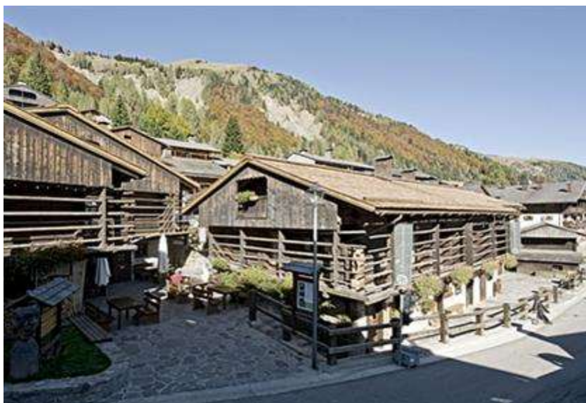
Slika 2: Sauris - Borgo San Lorenzo

Nahaja se v vasi Sauris, v Karnijskih alpah na nadmorski višini 1212 metrov. Prvič se jo omenja v 13.stoletju. Zaradi odročnosti in težke dostopnosti se je vas ohranila v svoji avtohtoni obliki. Obnavlja in razvija se s pomočjo modela razpršenega hotela. V središču vasi je ena sama recepsija, nastanitve pa so razporejene po posameznih hišah. Obiskovalci so zaradi modela razpršenega hotela vpleteni v celoto vasi, kjer lahko sodelujejo ali le spremljajo navade, tradicije in ritem lokalnih prebivalcev ( http://www.albergodiffusosauris.com/ ).