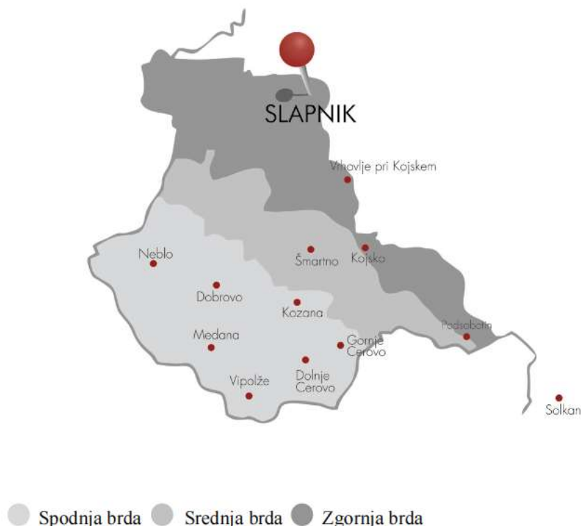
Slika 16: Goriška brda

Goriška brda so samostojna, geografsko in zemljepisno zaključena enota, ki ležijo na skrajnem zahodu Slovenije. So enotna pokrajina, ki je najbolj sredozemski del slovenskega dela Posočja in merijo 72 km 2 . Naravnogeografsko so izrazito omejena s treh strani. Na severu jih zapira visoko sleme Korada (812 m), vzhodna meja teče po apnenčastem slemenu med hriboma Korado in Sabotinom (609 m), ki ločuje Brda od Spodnje Soške doline, na zahodnem delu pa teče naravna meja po reki Idriji, ki loči gričevnato krajino Goriških brd od Furlanske nižine. Goriška brda se delijo na tri dele, in sicer na zgornja, srednja in spodnja Brda. Razmejitev temelji na razlikah v nadmorski višini, kamninski sestavi, naklonih površja, podnebnih značilnostih, prsti in posledično kmetijskih kulturah. Temeljna geološka lastnost je prevlada mehkega fliša, ki so ga številni majhni vodotoki preoblikovali v gričevja s slemeni. Trše in odpornejše karbonatne kamnine so le na skrajnem severu in jugovzhodu, kjer se pojavljajo značilnosti hribovja (Ažman Momirski et al., 2008, str. 13).