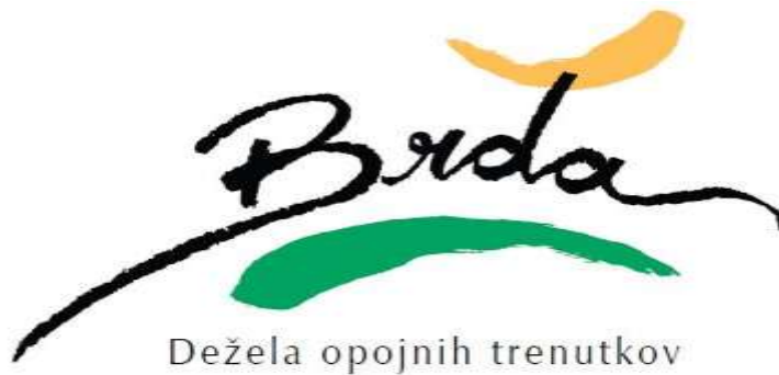
Slika 17: Enotna blagovna znamka Goriških brd

( http://www.slovenia.info/pictures%5Ctown%5C2%5C2013%5Clogo_slo_476492_505164.JPG )